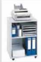
1617 48 x 39 x 67,7 cm (B x T x H)