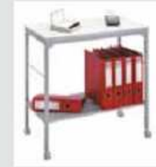
1679 73,5 x 40 x 72 cm (B x T x H)