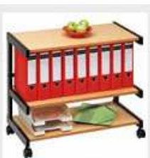
18B3/6 Buche natur/schwarz