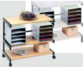
18A2 81 x 43 x 67 cm (B x T x H)