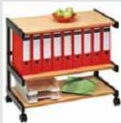
18B3 81 x 43 x 67 cm (B x T x H)