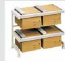
18H2 81 x 43 x 67 cm (B x T x H)