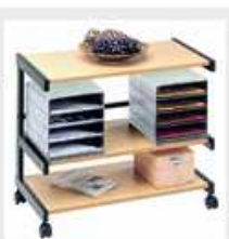
18A2/6 Buche natur/schwarz