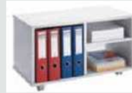
1720 73 x 39,5 x 42 cm (B x T x H)