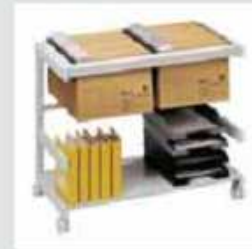
18H1 81 x 43 x 67 cm (B x T x H)